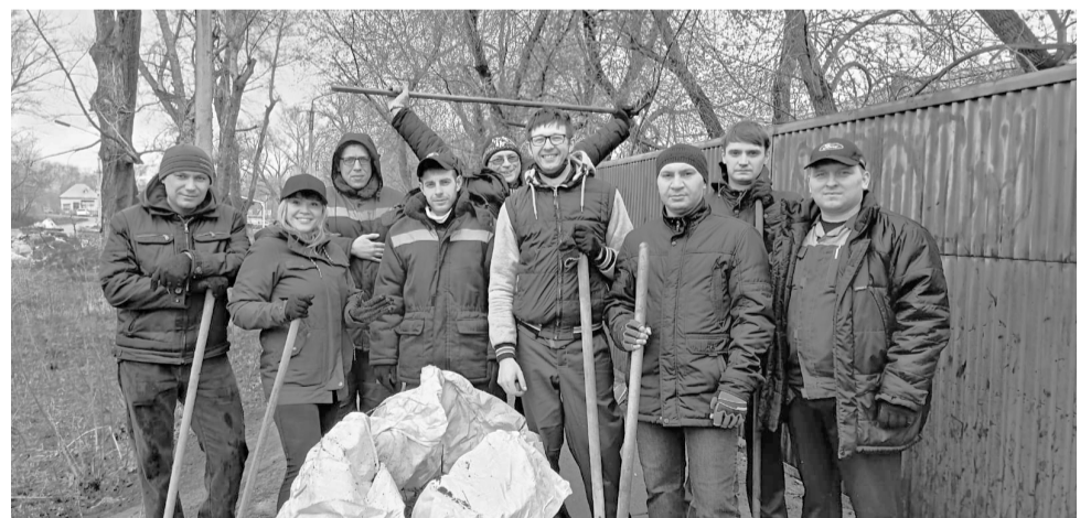
► Заводчане на уборке территории по улице имени Н.Ф. Светлова

С 15 апреля в Рубцовске стартовал месячник по санитарной очистке и благоустройству. Он продлится до 14 мая. За этот период необходимо провести санитарную очистку городских территорий от мусора, скопившегося за зимний период. К уборке территории города подключаются коллективы городских учреждений и организаций, студенты, местные жители.