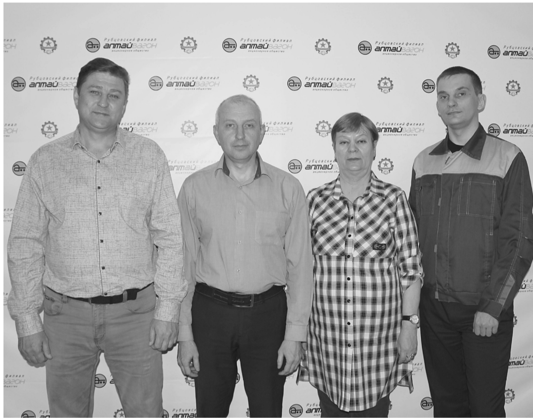
► Коллектив отдела охраны труда и производственного контроля

В ООТиПК большое внимание уделяют разработке локальных нормативных актов по охране труда и